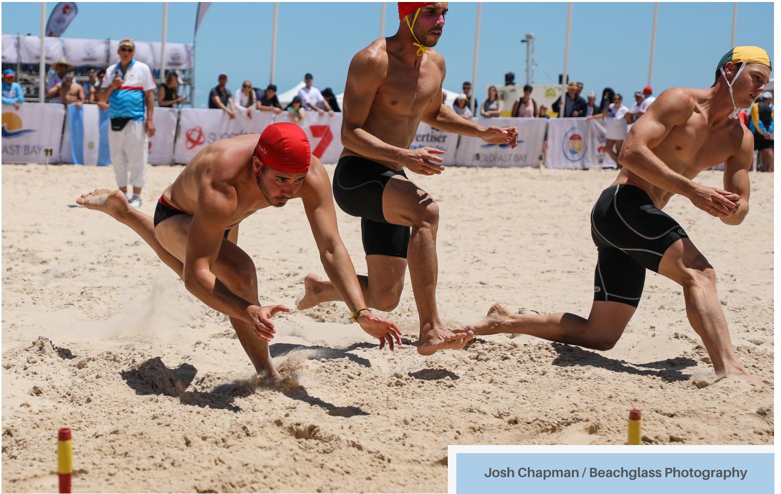
Josh Chapman / Beachglass Photography