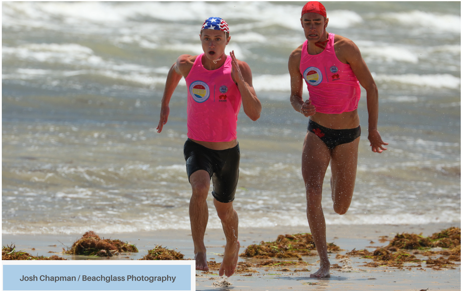
Josh Chapman / Beachglass Photography